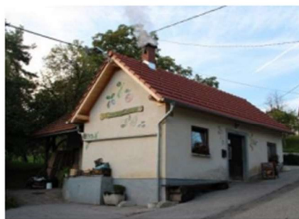
obisk sušilnice sadja (Dod Gradež)